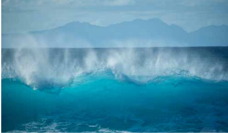
Die perfekte Welle: Hawaii ist weltweites Surfer-Paradies.

haltenen Tempel auf Hawaii. Hinter Kukuihaele liegt das Waipio Valley, eingerahmt von dunklen Felsen, die über 3.000 Meter aus dem Meer ragen. Inmitten eines üppigen Naturparadieses locken fruchtbare Plantagen und Felder und Wasserfälle wie die Hiilawe Falls.