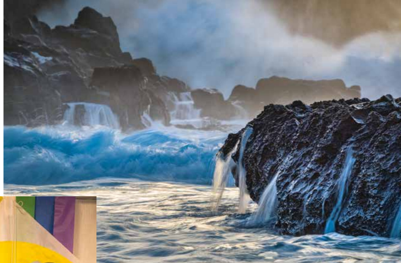
Geballte Urkraft: Kepuhi Beach auf Molokai.

ein Heer von Arbeitern lebte in Camps und Siedlungen. Es gab vier Kinos und zwei Bowlingbahnen. Heute lebt Molokai vor allem vom Tourismus.