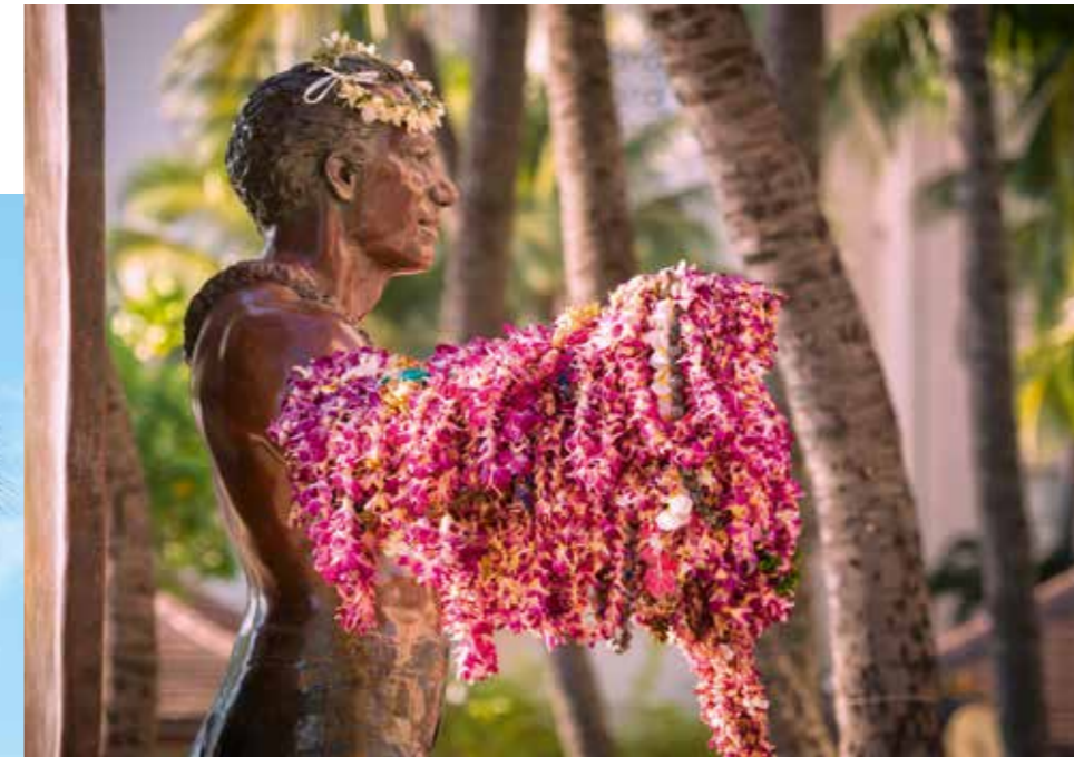
Ganz links: Waikiki Beach in Honolulu. Links: Duke Kahanamoku (1890–1968) gilt als Vater des modernen Wellenreitens.