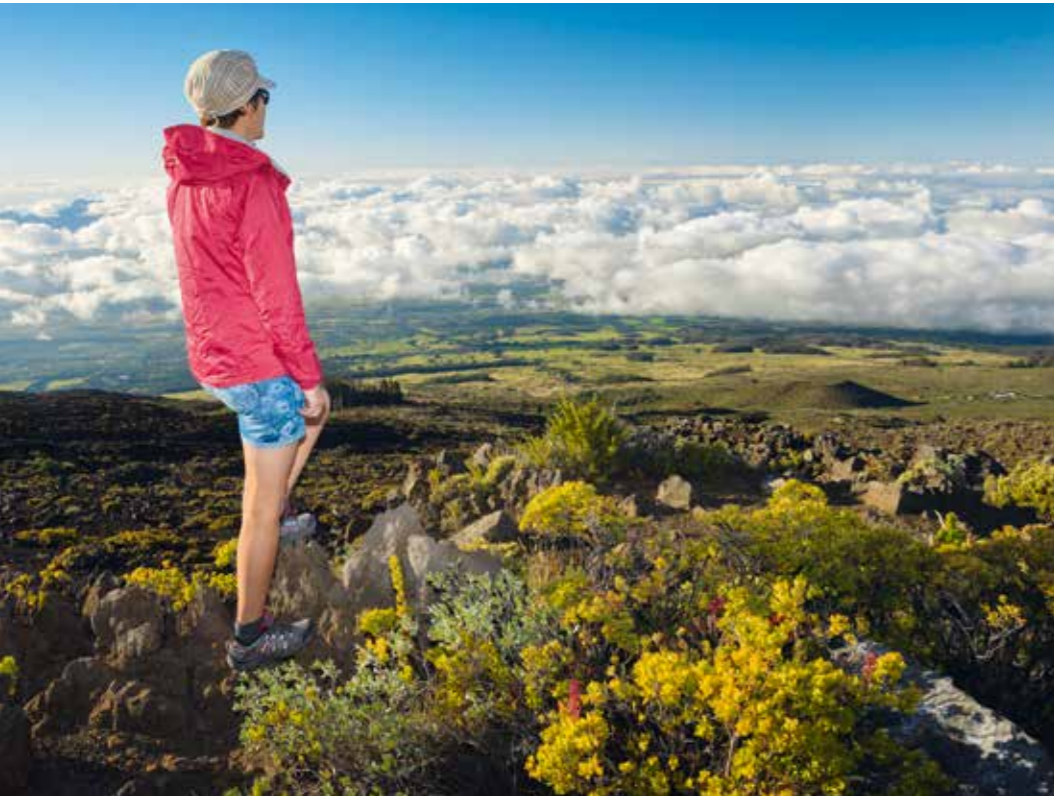
Über den Wolken: Haleakala National Park auf Maui.