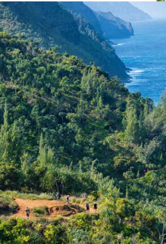
Exotisches Kauai: Wanderung an der Na Pali Coast.