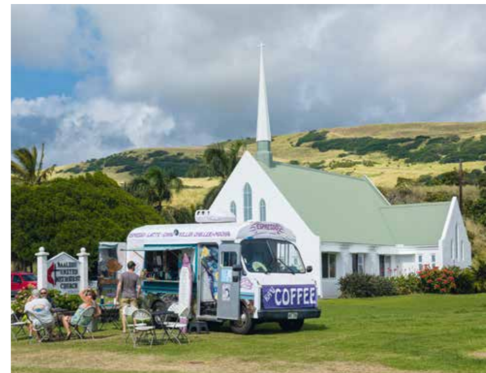
Hawaiian Spirit: Kaffeepause auf Big Island.

Kailua-Kona ist eine geschäftige Kleinstadt mit zahlreichen Hotels, Restaurants und Shops. Farbenprächtige Bougainvillae ranken sich an den