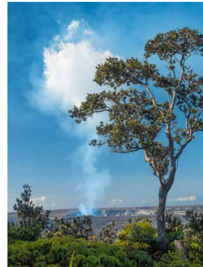
Rauchzeichen im Volcanoes National Park.

Steinmauern der Apartmenthäuser und Einkaufszentren am Alii Drive empor. Die Wellen des Pazifik rollen gegen die Steinmauer im Hafen. In der Innenstadt und an der zerklüfteten Südküste erinnern zahlreiche Heiaus (Tempel) und historische Gebäude an die bewegte Vergangenheit von Big Island. Seit 1838 ist die Mokuauikaua Church ein Wegweiser für Seefahrer und Wanderer. Die Mauern der Kirche bestehen – wen wundert's? – aus schwarzen Lavasteinen.