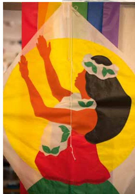
Filigranes Kunstwerk: Drachen der Maunaloa Kite Factory.

Um zu sehen, wie die Einheimischen ihr Paradies hüten, kann man an einer Farmtour teilnehmen, z.B. auf der Purdy's Natural Macadamia Nut Farm. Hawaii ist der weltweit führende Produzent von Macademianüssen.