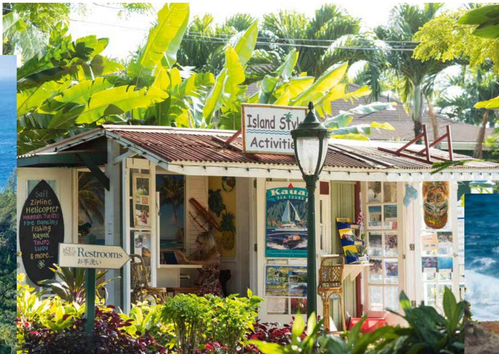
Rechts: Biker am Kealia Beach.